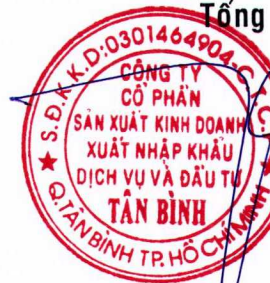
TRẦN QUANG TRƯỜNG