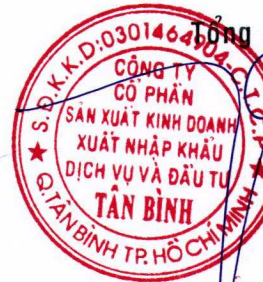
TRẦN QUANG TRƯỜNG