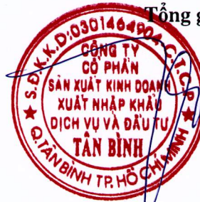
TRẦN QUANG TRƯỜNG